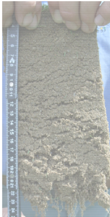
Abb. 4: Zustand Greensaufbauten Platz Sagogn, August 2008.