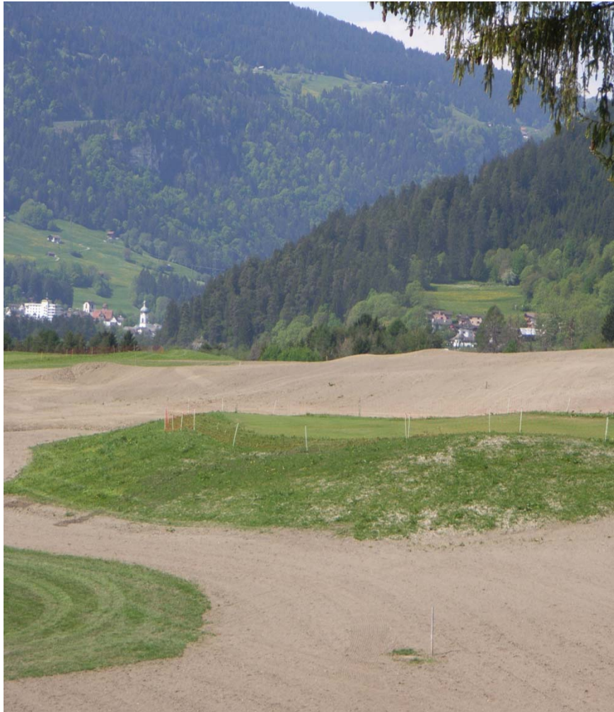
Abb. 2: 2. Bauphase, 2008 Platz Sagogn. Bearbeite Fairways. Die Bodenbearbeitung mit der Fräse kann sich negativ auf die Bodenstruktur ausgewirkt haben.

Der Club hat etwa 500 Mitglieder, wobei neben Mitgliedern aus der Region Zweitwohnungsbesitzern grosse Bedeutung zukommt.