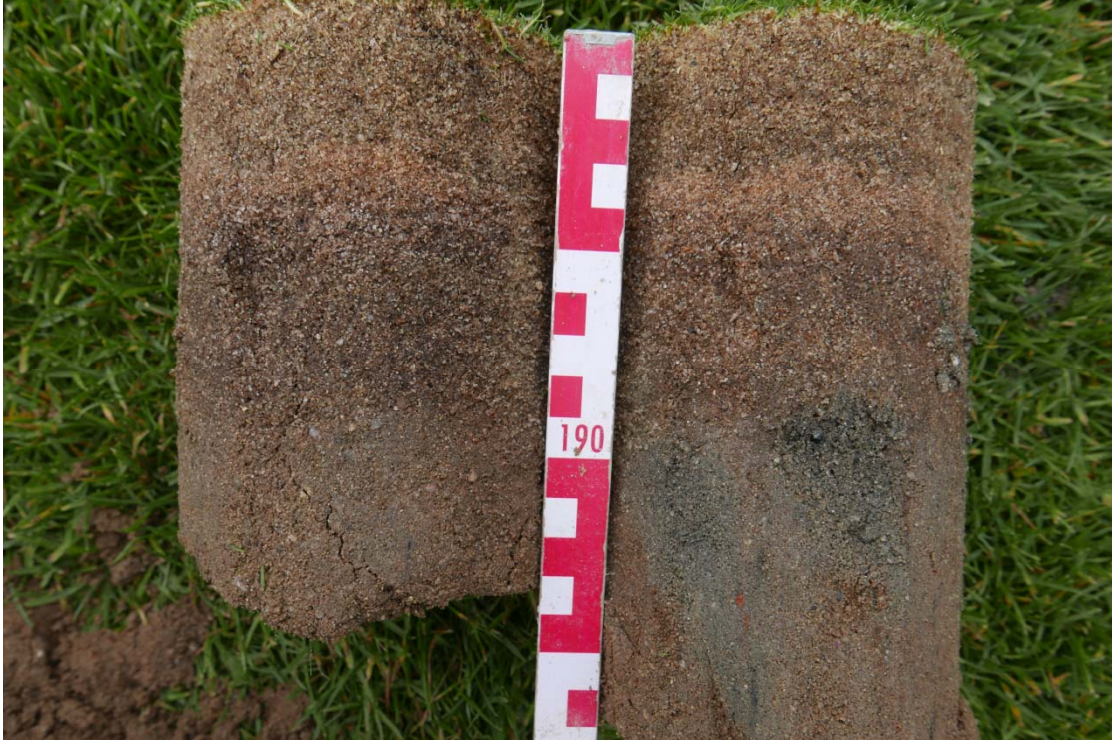
Abb. 9: Bodenprofile auf Green 11. Deutlich ist jeweils der Übergang von Original-Rasentragschicht (mit hellem Sand durchsetzt) zum Pflegehorizont in etwa 9 cm Tiefe zu erkennen. Die Original RTS auf dem Profil rechts zeigt deutliche graue Verfärbungen, die auf (zeitweise) anaerobe Verhältnisse hindeuten.