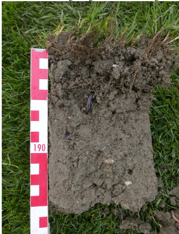
Abb. 6: Bodenprofil 0-20 cm FW 1. Oberste Zentimeter des Profils stark durchwurzelt, Krümelstruktur, einsetzende Filzbildung. Darunter Boden ohne deutliche Gefügeausbildung, nur vereinzelt durchwurzelt, mit Regenwurmängen.

Relativ flaches Fairway unterhalb der Driving Range. Frühere Nutzung als Maisacker.