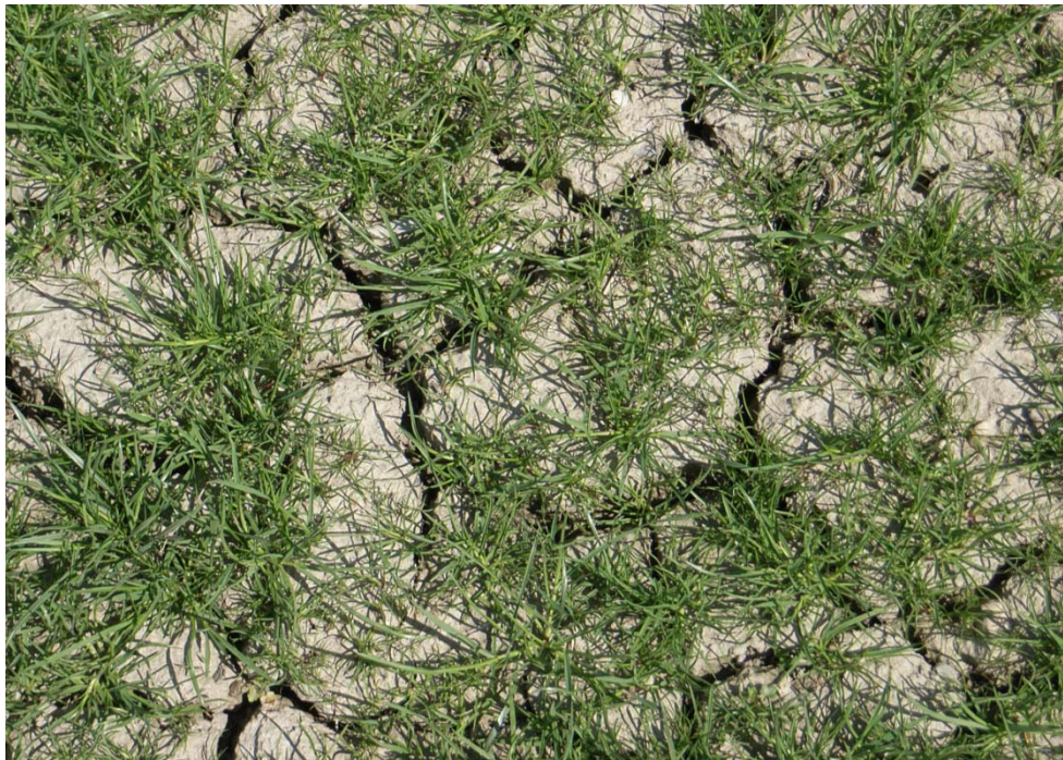
Abb. 3: 2. Bauphase, 2008, Platz Sagogn. Eingesätes Fairway mit starken Schrupfungsrisse aufgrund hohen Ton- und Schluffgehaltes und fehlenden Bodengefüges, Polyedergefüge. Bodenoberfläche verschlammmt.

Die Düngung wurde in den letzten Jahren deutlich zurückgefahren und bewegt sich gegenwärtig im Bereich von etwa 10 \text{ g N m}^{-2} \text{ a}^{-1} , überwiegend flüssig. Granulatgaben werden im Frühjahr und Herbst gegeben.