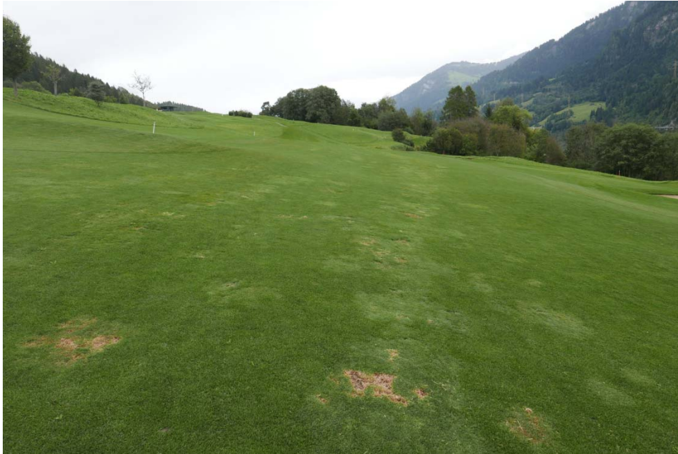
Abb. 8: Blick von Beprobungsstelle FW11 über Fairway 11. Deutlich erkennbar ist ein Agrostis stolonifera -Streifen (andere Farbe und Textur, Fehlstellen), der pflegerisch sehr anspruchsvoll ist. Wahrscheinlich ist dieser Streifen auf „Verschleppung“ von Saatgut bei der Ansaat zurückzuführen