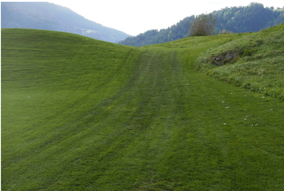
Abb. 10: Schlechte Befahrbarkeit bzw. starke Schäden (auch hier nicht sichtbare Strukturschäden im Boden) des Fairwaybereichs aufgrund der vorherrschenden Bodenarten mit niedriger Wasserdurchlässigkeit und geringer mechanischer Beanspruchbarkeit bei nassen Verhältnissen.