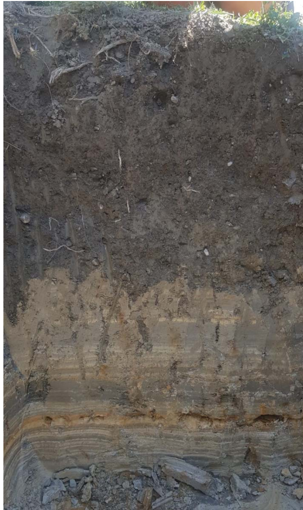
Abb. 1: Deutlich geschichtete Ablagerung von Seesedimenten mit hohem Schlämmkornanteil unter verbrauntem Oberboden bei Green 2 (Foto Kurt Deflorin, Sommer 2019)

sollte. Zusätzlich treten auf Fairways 9 und 11 und auf der Driving Range Zutritte von Hangwasser auf. Auf den Fairways wurden beim Bau keine Drainagen erstellt.