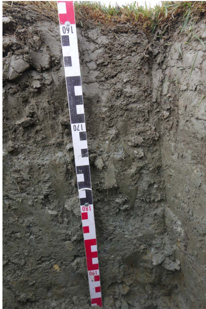
Abb. 7: Bodenprofil auf FW 11. Starke Durchwurzelnung, Beginnende Bildung eine Filzschicht und Krümelstruktur in den obersten Zentimetern des Profils. Darunter gefügeschwacher Boden mit einzelnen Wurzeln. Boden im unteren Bereich teilweise ausgebleicht und mit Rostflecken. Diese Art der Pseudovergleyung deutet auf Grundwassereinfluss hin.

Gesamtdeckung 98%: Lolium perenne 55%, Agrostis stolonifera (fleckig verteilt) 40 %, Festuca rubra 1%, Poa supina 2% sowie in geringen Anteilen Poa pratensis , Trifolium repens und Taraxacum officinale .